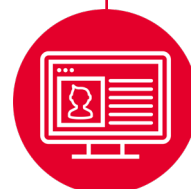
Einsatz von Sicherheits-Technologien