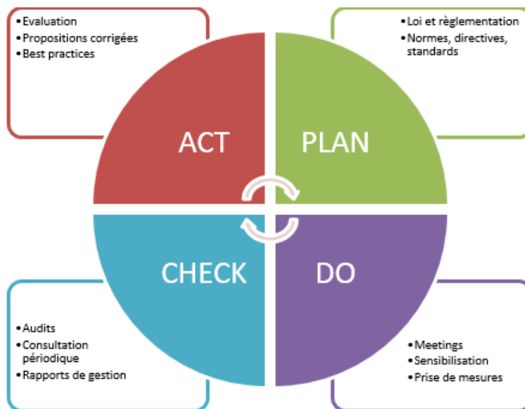
Figure 1 PDCA-cyclus

La protection de la vie privée est un processus continu de qualité. Plan, Do, Check, Act (PDCA) forment ensemble le système de gestion de la vie privée. Ce cycle de qualité est illustré à la figure 1.