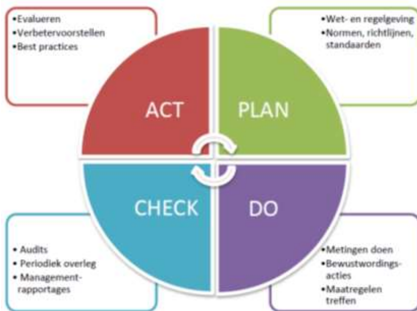
Figuur 1 PDCA-cyclus

Het borgen van privacy is een continu kwaliteitsproces. Plan, Do, Check, Act (PDCA) vormen gezamenlijk het managementsysteem van privacy. Deze kwaliteitscyclus is in Figuur 1 weergegeven.